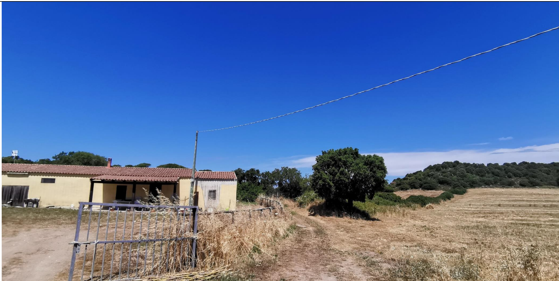
Fabbricato rurale del sig. Dasara. E' ben visibile la strada sterrata che normalmente viene usata coi mezzi pesanti per la semina e l'aratura dei terreni.